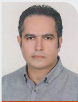
نویسنده فریبرز خنارصنمی